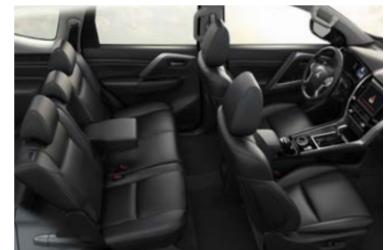
TAPICERÍA EN CUERO CON MANDO ELÉCTRICO EN LA SILLA DEL CONDUCTOR, CONSOLA DE PISO Y MATERIAL DEL TAPIZADO CON INSERTOS DE PVC