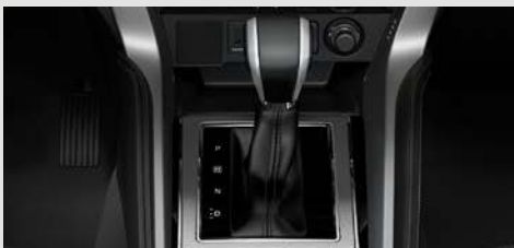
CAJA AUTOMÁTICA SPORT MODE de 8 velocidades para una conducción eficiente