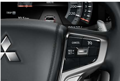
PADDLE SHIFTERS Manual de 8 velocidades

Diseño avanzado que se centra en la comodidad de conducción, la amplitud, la inteligencia y operación intuitiva.