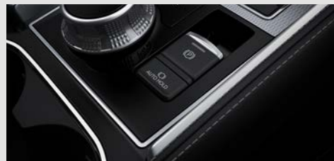
FRENO DE ESTACIONAMIENTO ELECTRÓNICO Y "AUTO HOLD"