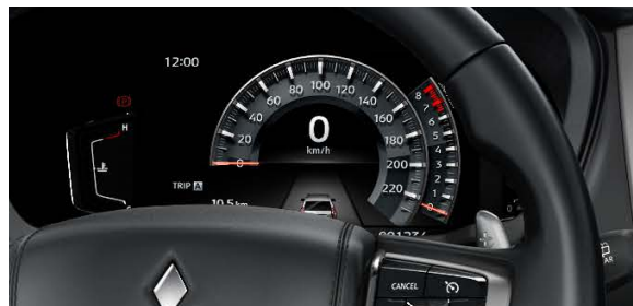
TABlero DE INSTRUMENTOS DIGITAL DE 8" LCD A COLOR CON CONTROL EN EL VOLANTE