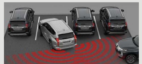
ALERTA DE TRÁFICO CRUZADO TRASERO [RCTA]